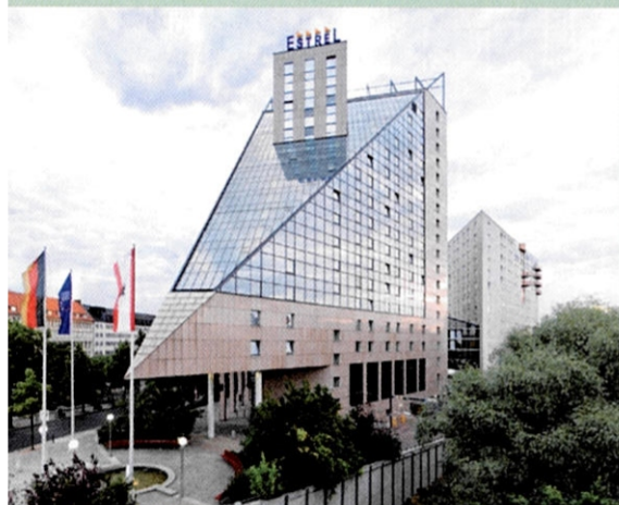
Berlin im Juni 2011 [herzbergkuzarow Sports Management & Coaching]

Berlin - neuer Standort, neues Konzept, modernes Image